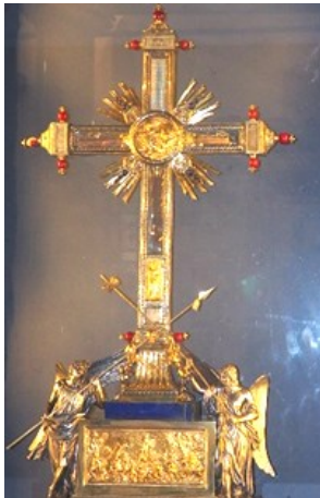
Szent Kereszt ereklye - Róma, Santa Croce in Gerusalemme

Én pedig, ha fölmagasztalnak a földről, mindent magamhoz vonzok. (Jn. 12, 32)