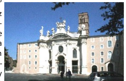
Santa Croce in Gerusalemme, Róma

A kereszt ereklyék is kalandos úton kerültek Rómába, az Ilona császárnő egykori palotáján épült Santa Croce in Gerusalemme (Jeruzsálemi Szent Kereszt) Bazilikába. A középkor szokása szerint az ereklyék egy-egy darabját a világ különböző templomaiba szállították, hogy ott is tisztelhesék. Egyes szkeptikus vélemények szerint a világban található keresztzilánkokból sok „szentkeresztet” lehetne összeállítani. Ám a keresztény hívő számára nem a tárgy az elsődleges, hanem az, hogy Isten szeretetére emlékeztet. Magyarországon is több helyen őriznek Róma által hitelesített kereszt-ereklye darabkát, például Nyúl község templomában, amelyet Mária Terézia adományozott a falunak, Budapesten pedig a Belvárosi templomban és a mi Kruspér utcai Kápolnánkban is. A hagyományos lengyel-magyar testvériség jegyében ismerjük a Szent Imre által a Świątę Krzyż (Szent Kereszt) bencés kolostornak (Łysa Góra) adományozott ereklyét.