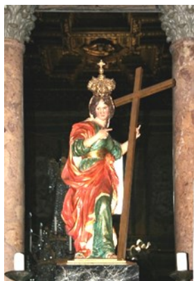
Szent Ilona sírja - Róma, Santa Maria in Aracoeli Bazilika

Ilonát szentként tiszteli a római és keleti egyház is, sírját Rómában találhatjuk a Santa Maria in Aracoeli templomban.