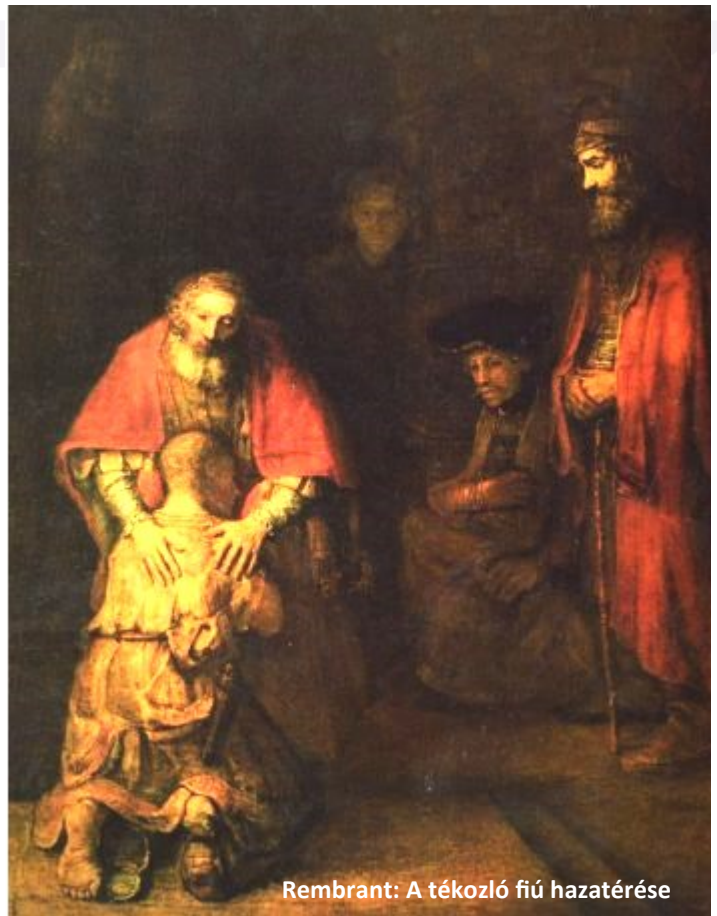
Rembrandt: A tékozló fiú hazatérése

Bizony, ahhoz, hogy meghalljuk az Úr szavát, szükségünk van arra, hogy megálljunk, elcsendesedjünk, keressük az Ő jelenlétét.