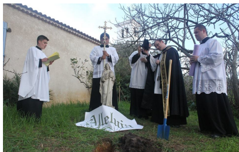
Az Alleluja temetése

A nagyböjt előtti utolsó vasárnapon elhangzik az „Alleluja búcsúztató”. Ez mintegy kihirdeti, hogy elközelgett a böjti időszak, és előrevetíti számunkra a Húsvétot: „E nap még hangzik az Alleluja, a böjtben elnémul szép dallama. Elűzi bűnünk szégyene és bánata” -mondja az ének, s egyúttal felhívja a figyelmünket arra is, hogy a farsangi vigadozások után elérkezett a bűnbánat ideje. Az Alleluja búcsúztatásának bizonyos vidékeken nagy hagyománya van. Van olyan hely, ahol szó szerint eltemetik az Alleluját (lásd kép)! A dallam pedig az „Ó ifjak, lányok, gyermekek” kezdetű húsvéti ének dallama, amellyel a húsvétvasárnapi szentmiséket zárjuk. Ez a dallam így keretbe foglalja az egész ünnepi időszakot és jelenvalóvá teszi számunkra az ígéretet, hogy „örök húsvétal vár az ég”.