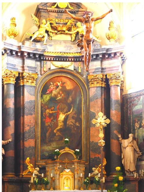
Szent Bertalan templom, Gyöngyös

Mestereknek Mestere, mondá meg, mi az Egy (Kettő, Három...)?