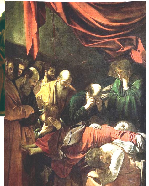
Caravaggio: Mária halála (részlet)