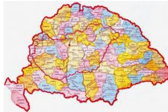
Juhász Gyula: A békekötésre!

Magyar Tiborc, világ árvája, pórja Nézz sírva és kacagva a nagyokra, Kik becstelen kötéssel hámba fognak, Hogy tested, lelked add el a pokolnak!